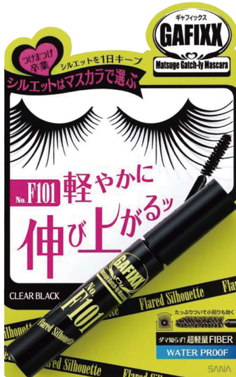
ギャフィックス マスカラ F101 (クリアブラック) 1,300円 (税込1,365円)

つけまつげは、もう卒業。 でも、フツのマスカラじゃ、ツマンない。 自分のまつげで、もっと軽やかに華やかに。 まつげメイクを楽しみましょう。